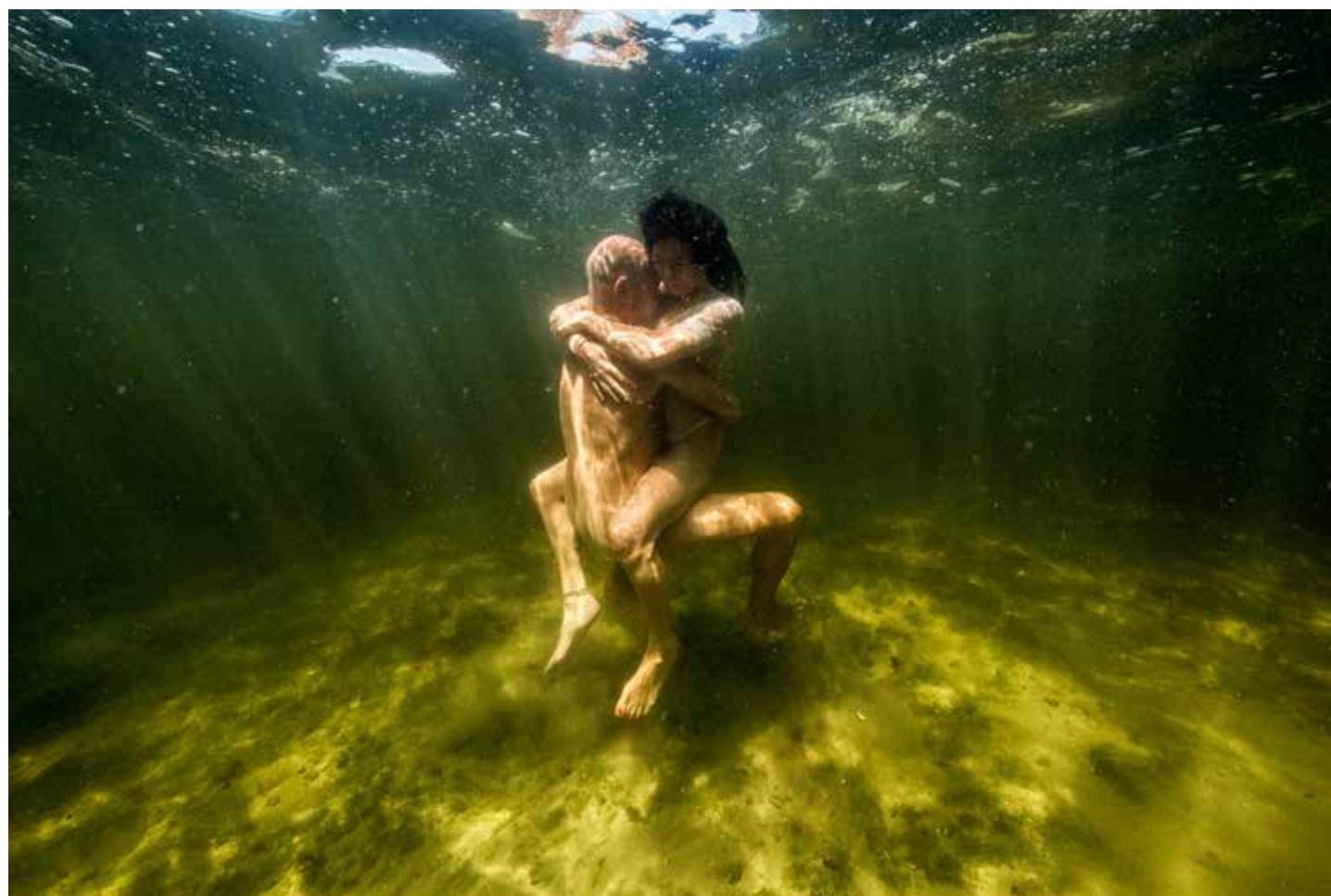
● Camera Nikon D810 | Diafragma f/9.0 | Sluittijd 1/500 | ISO 640

‘Ik heb deze foto gemaakt voor een bevriend stel. Je kunt duidelijk zien hoeveel ze van elkaar houden. Dit is toch precies zo’n foto die je boven je bank zou willen hangen?’