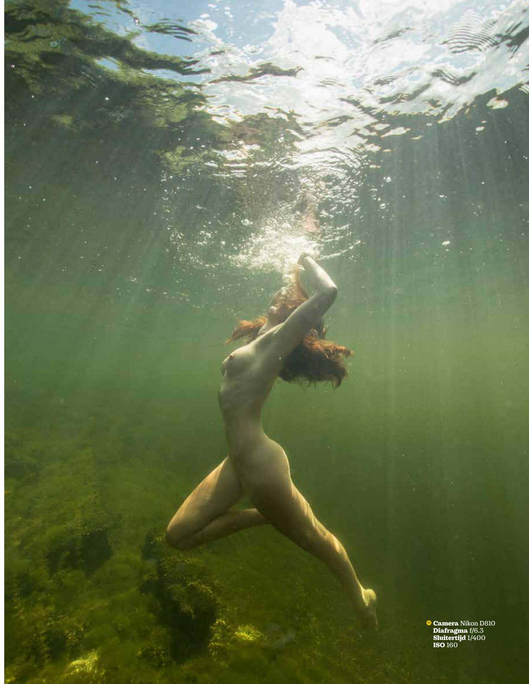
● Camera Nikon D810 Diafragma f/6.3 Sluittijd 1/400 ISO 160

● ‘Deze dame had, net zoals bijna alle modellen die ik eerder heb gefotografeerd, geen ervaring met poseren onder water. Ik begeleid ze ter plekke om hen de technieken aan te leren. Bovendien vind ik het werken in buitenwater erg mooi. Deze foto is in Nederland gemaakt.’